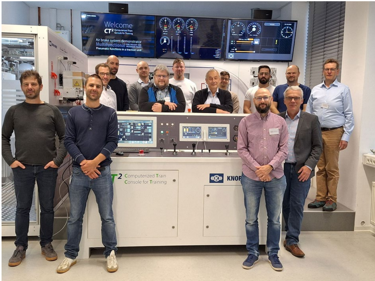
Seminar Teilnehmer und Referenten des DMG-Fachseminars F11-2025