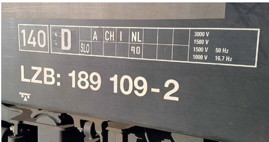
Länderraster einer Lokomotive